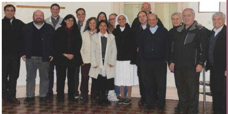
Encuentro del EAS en la Iglesia de Jesús Sacramentado