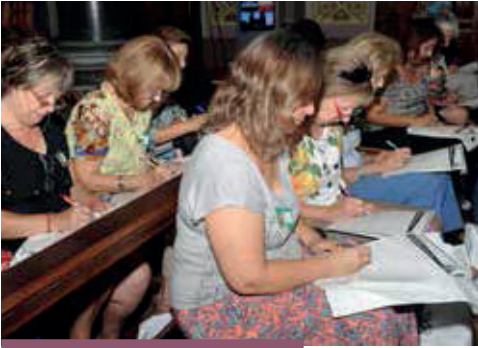
Catequistas respondiendo la consulta en el EAC

1000 participantes, trabaja también contenidos vinculados con el estilo sinodal. A través de expositores como el Pbro. Gerardo Söding, desde lo bíblico, y Mons. Eguía, presentando el camino realizado y las perspectivas hacia adelante, proponiendo iniciar la etapa de la Consulta misionera. También se realiza un ejercicio sinodal, completando una Consulta específica, preparada por la Junta Catequística Arquidiocesana.