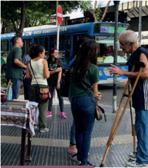
Consulta realizada en Vicaría Devoto

Se presentaron algunos resultados, teniendo en cuenta que a mediados de enero se habían cargado en el sistema más de 3.600 respuestas. A partir de una lectura rápida, se destacó el hecho de que el 95,77% responde que haber encontrado a Jesús le da sentido a su vida, pero solo el 59,17% manifiesta sentirse parte de una comunidad. Esto es simplemente un ejemplo del desafío que queda por delante para discernir los aspectos necesarios en orden a hacer