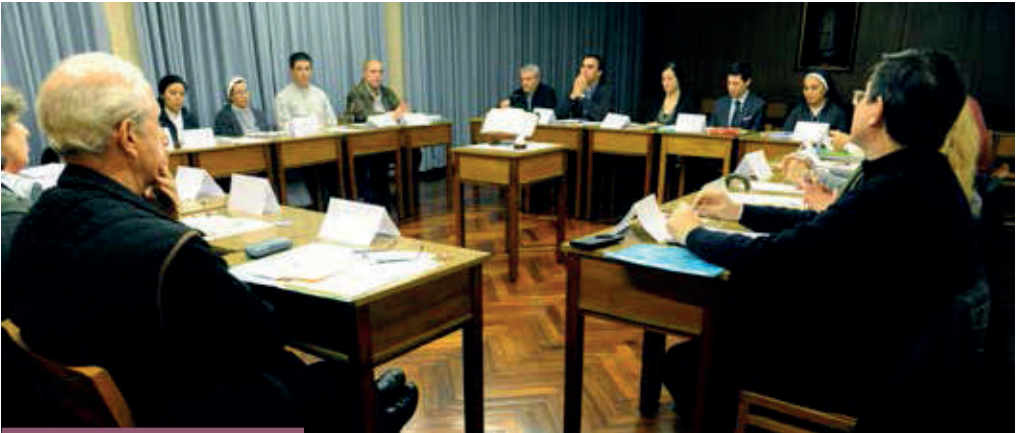
Reunión del EAS en la Curia Metropolitana