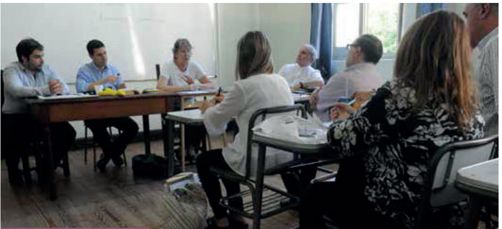
Presencia de integrantes de la Pastoral Familiar en el EAC

Mons. Poli comenzó presentando el motivo de la invitación en el marco del Sínodo Arquidiocesano y la actitud de escucha que quiere privilegiarse. Por eso la invita-