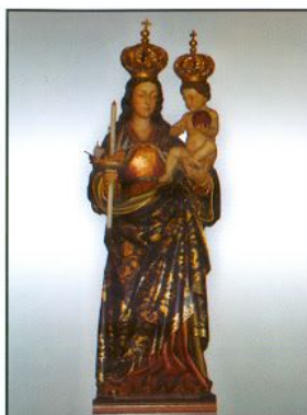
Nuestra Señora de Buenos Aires